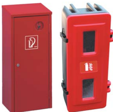
Plåtsåp med nyckellås