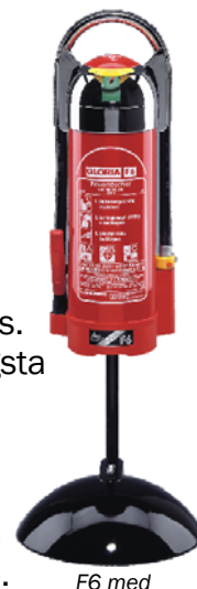
F6 med silvertopp och golvstativ

Den kan också fyllas med alkoholbeständig skumvätska, något som är omöjligt med ordinarie släckare.